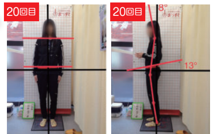
After: 首が真っ直ぐに近くなり骨盤の歪みも改善