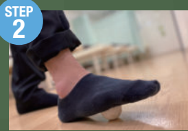
STEP 2 2~3分転がしたら、反対の足も同じように転がします。