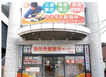
藤接骨院安西院外観