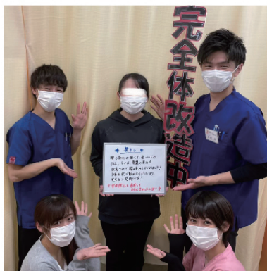
患者様から喜びの声も！